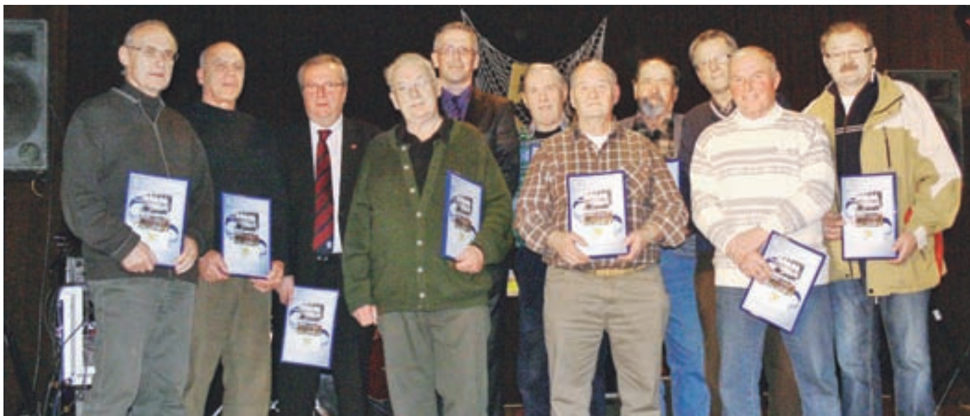
ŠD Storžič, prva enajsterica

Leta 1960 je v Preddvoru nastalo športno društvo. Obletnico so proslavili 10. decembra letos.